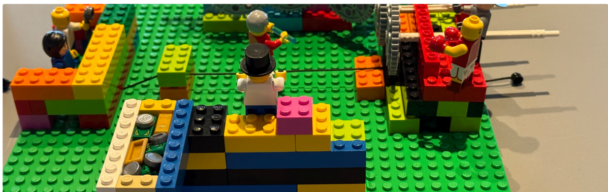
Eksempel på modeller fra en tidligere workshop

Denne øvelse giver ofte overraskelser, både for den enkelte og for gruppen. Udfordringer der aldrig er blevet sat ord på, bliver pludselig synlige.